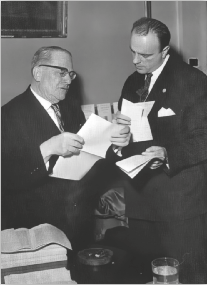
Schmitt con Manuel Fraga Iribarne en 1962, no Instituto de Estudios Políticos de Madrid, revisando o texto da conferencia que vai impartir