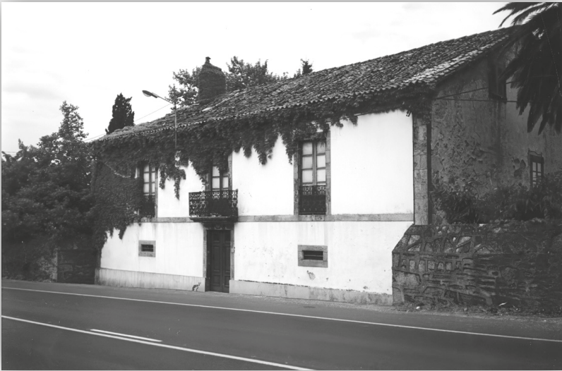
Nesta casa da familia Otero en Casalonga (Teo) redactou Schmitt o limiar á edición en español de Ex captivitate salus .