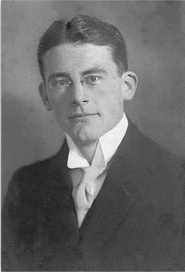
Carl Schmitt en 1912.