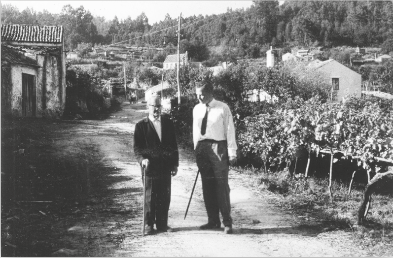
Con E. W. Bückenförde (á dereita) en Bordóns (Sanxenxo) en 1964