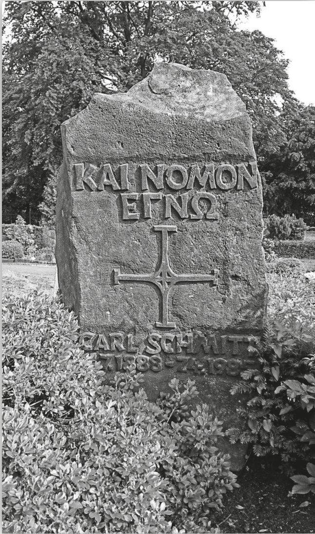
Lápida da tumba de Carl Schmitt.