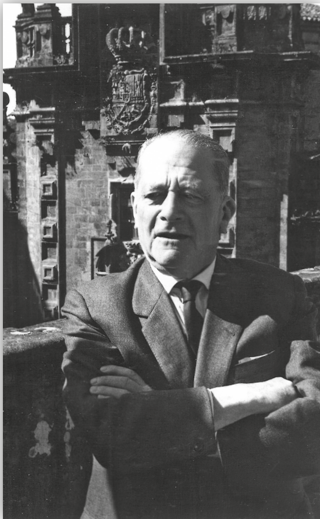
Ao fondo a igrexa de San Fructuoso, en Santiago de Compostela, agosto de 1966