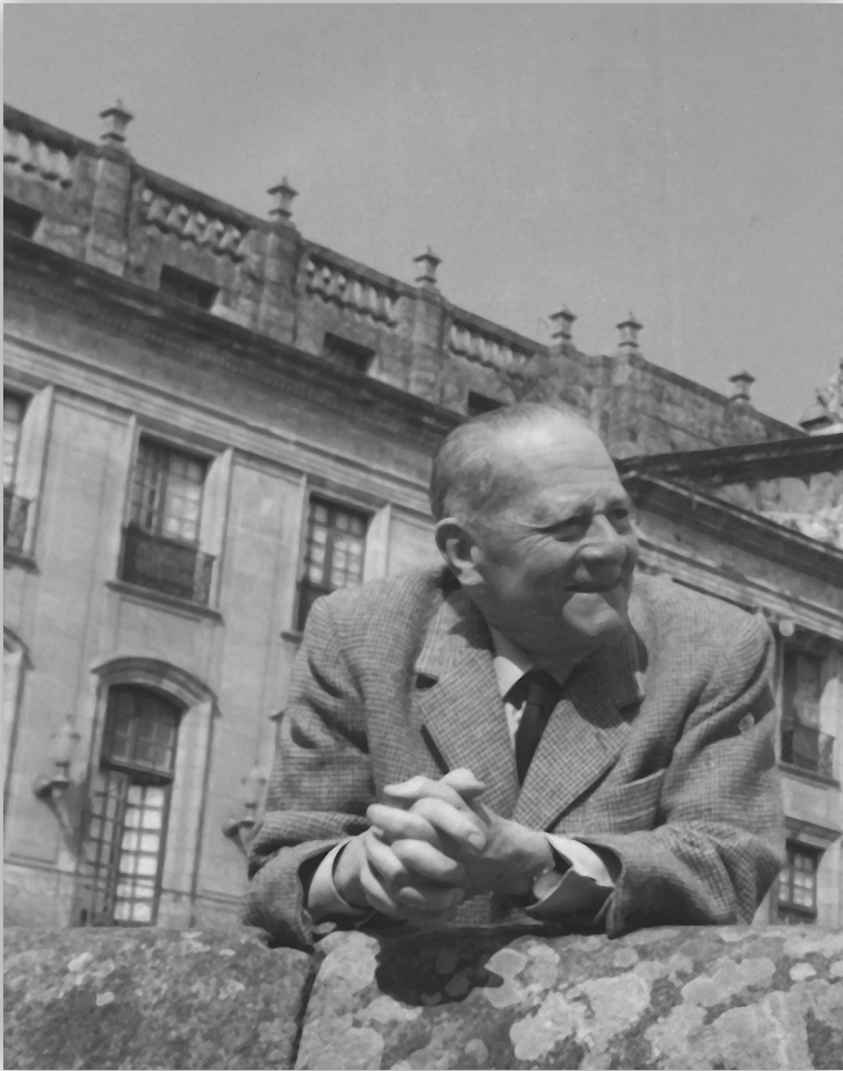
Setembro 1967, na praça do Obradoiro