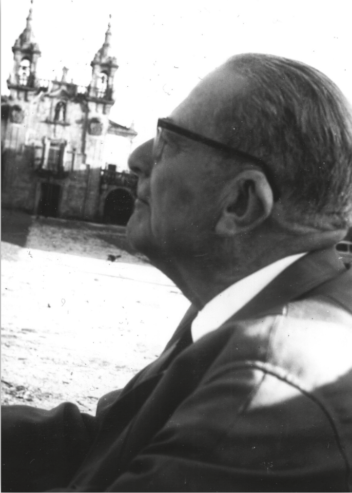
No pazo de Oca, xullo de 1968