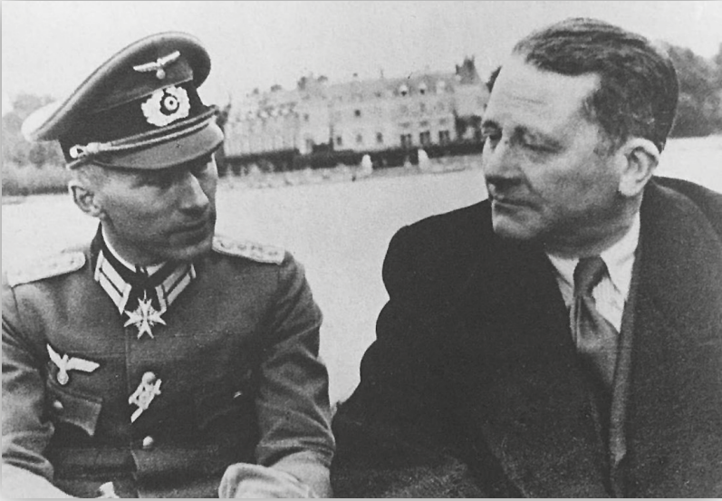
Carl Schmitt (á dereita) con Ernst Jünger, nunha barca no lago de Rambouillet o 19 de outubro de 1941. Ese mes, Schmitt estivo en París impartindo conferencias por invitación do Deutschen Institutes