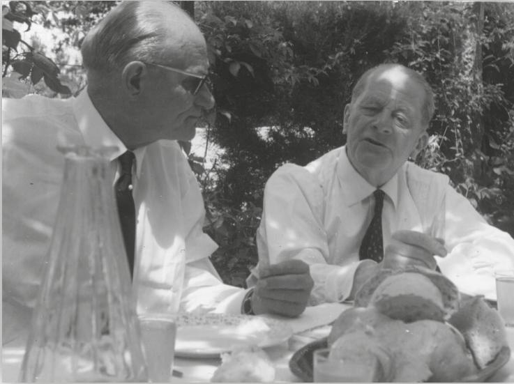
Con Ernst Forsthoff (á esquerda) xantando no 80 aniversario de Carl Schmitt, en Rois