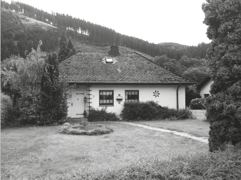
A casa de Plettenberg-Pasel